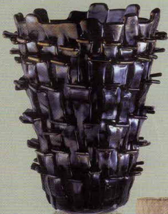
SELTENHEITSWERT Nummerierte Vase „Ritagli“ (H 30, Ø 22 cm) aus Muranoglas. Von Venini über Harmstorf & Petz, 3725 €.