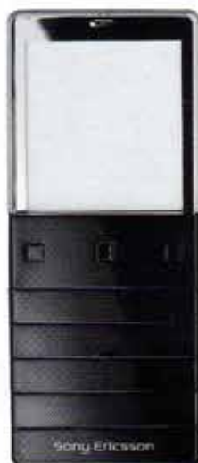
DURCHBLICK Limitiertes Handy „Xperia Pureness“ mit transparentem Display, beleuchteter Tastatur und Rahmen. Von Sony Ericsson, 699 €.