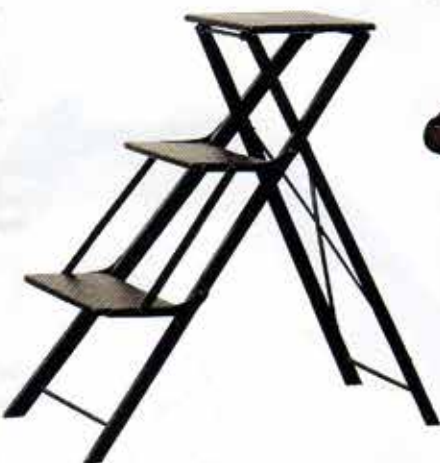
HOCHFORM Bibliotheksleiter „Hastings“ (H 72 x B 33 x T 70 cm) mit Holzstufen auf Metallgestell. Von Mis en Demeure, 210 €.