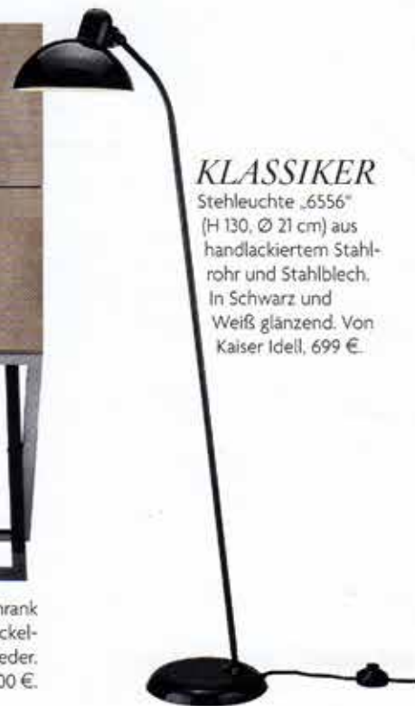
KLASSIKER Stehleuchte „6556“ (H 130, Ø 21 cm) aus handlackiertem Stahlrohr und Stahlblech. In Schwarz und Weiß glänzend. Von Kaiser Idell, 699 €.