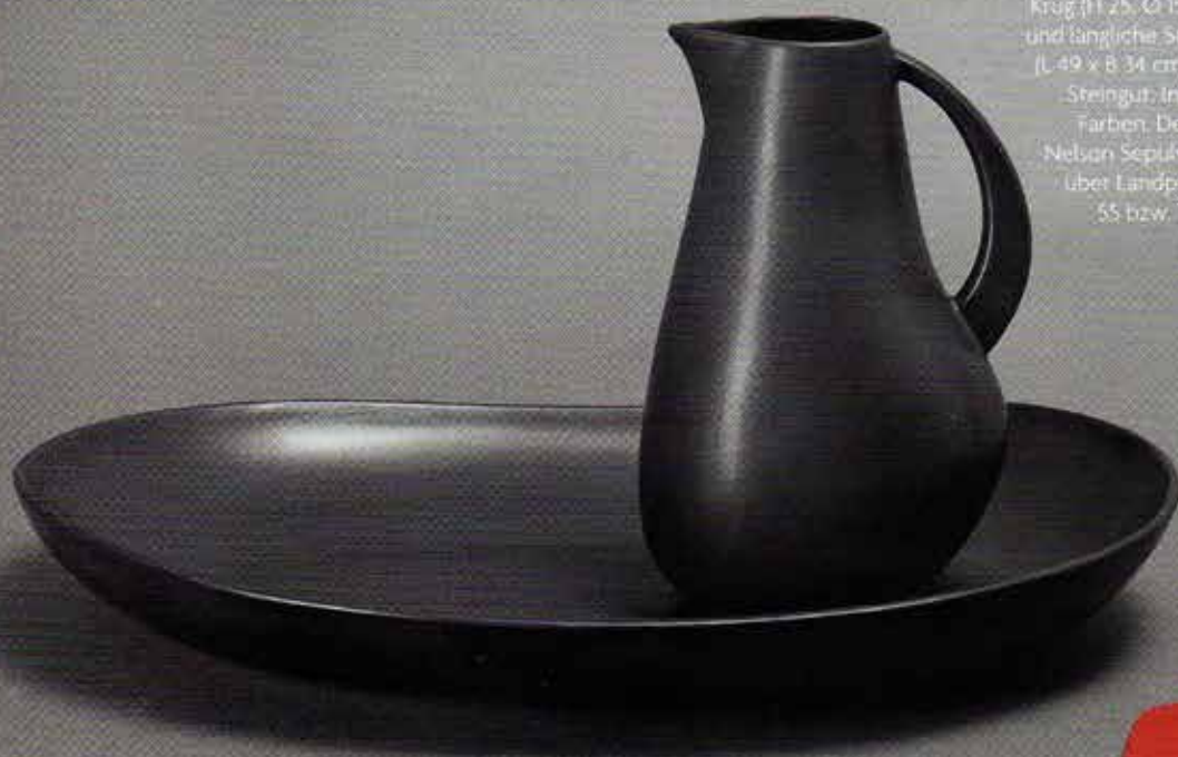
APART Krug (H 25, Ø 15 cm) und längliche Schale (L 49 x B 34 cm) aus Steingut, in fünf Farben. Design: Nelson Sepúlveda, über Landpartie, 55 bzw. 79 €.