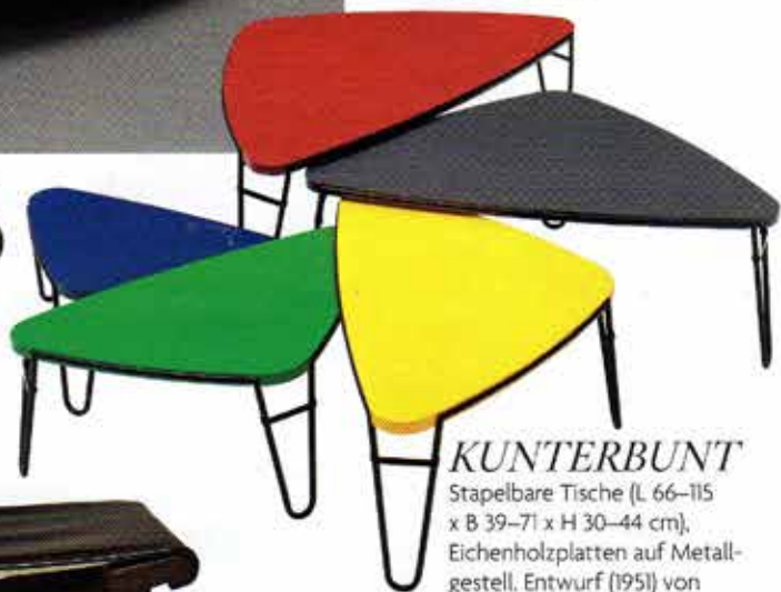
KUNTERBUNT Stapelbare Tische (L 66–115 x B 39–71 x H 30–44 cm), Eichenholzplatten auf Metallgestell. Entwurf (1951) von Charlotte Perriand für Cassina.

Lieblingsstücke für Futuristen, Minimalisten und Raritätensammler