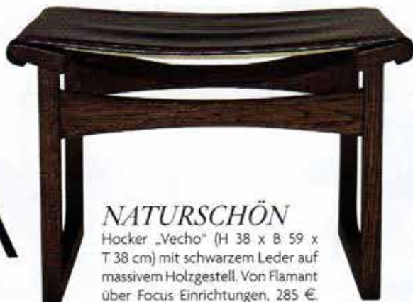
NATURSCHÖN Hocker „Vecho“ (H 38 x B 59 x T 38 cm) mit schwarzem Leder auf massivem Holzgestell. Von Flamant über Focus Einrichtungen, 285 €.