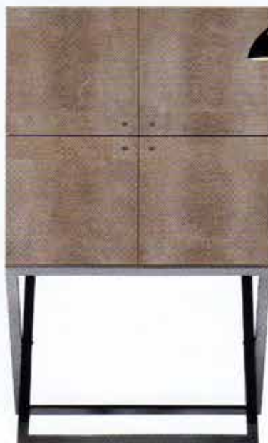
SALONFÄHIG Barschrank „Club“ (H 130 x B 80 x T 60 cm). Nickelgestell und Bezug aus Eidechsenleder. Limit. Edition von Armani Casa, 26 500 €.