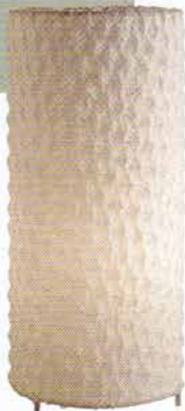
ZART Leuchte „Kukuru“ (H 45 cm). Mit Shibori-Relief veredeltes Polyester. Über Luxury Fair Craft, 450 €.

WANDKUNST Die Whitworth Art Gallery in Manchester zeigt Tapeten, die 30 namhafte Künstler gestalteten, darunter Damien Hirst und Thomas Demand. Vom 6. 2. bis 3. 5., whitworth.manchester.ac.uk,