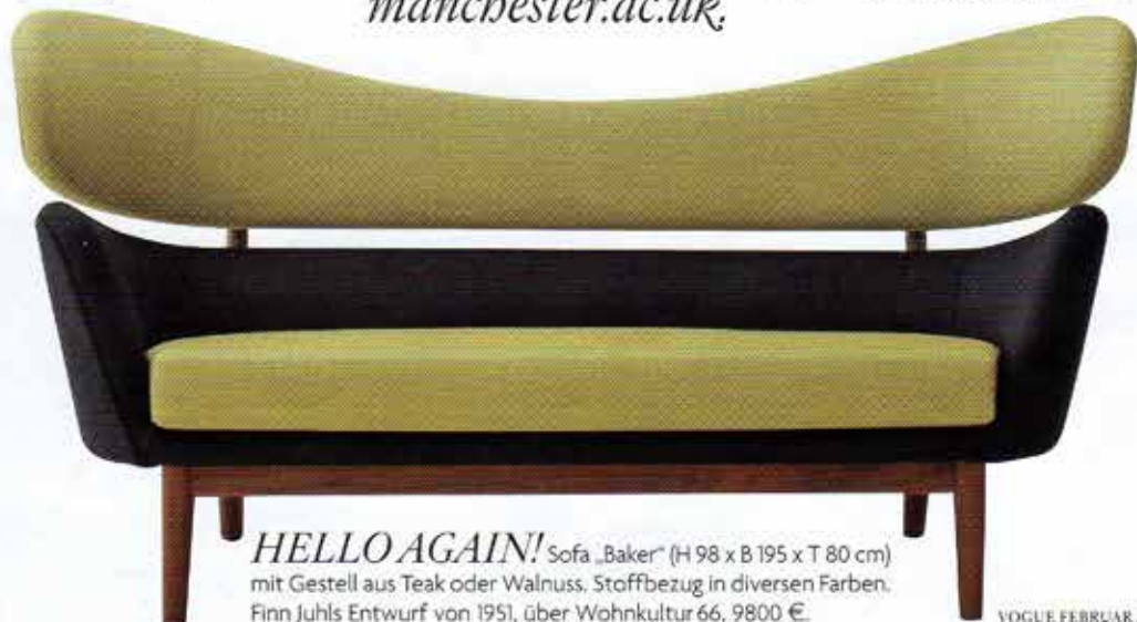
HELLO AGAIN! Sofa „Baker“ (H 98 x B 195 x T 80 cm) mit Gestell aus Teak oder Walnuss. Stoffbezug in diversen Farben. Finn Juhls Entwurf von 1951, über Wohnkultur 66, 9800 €.